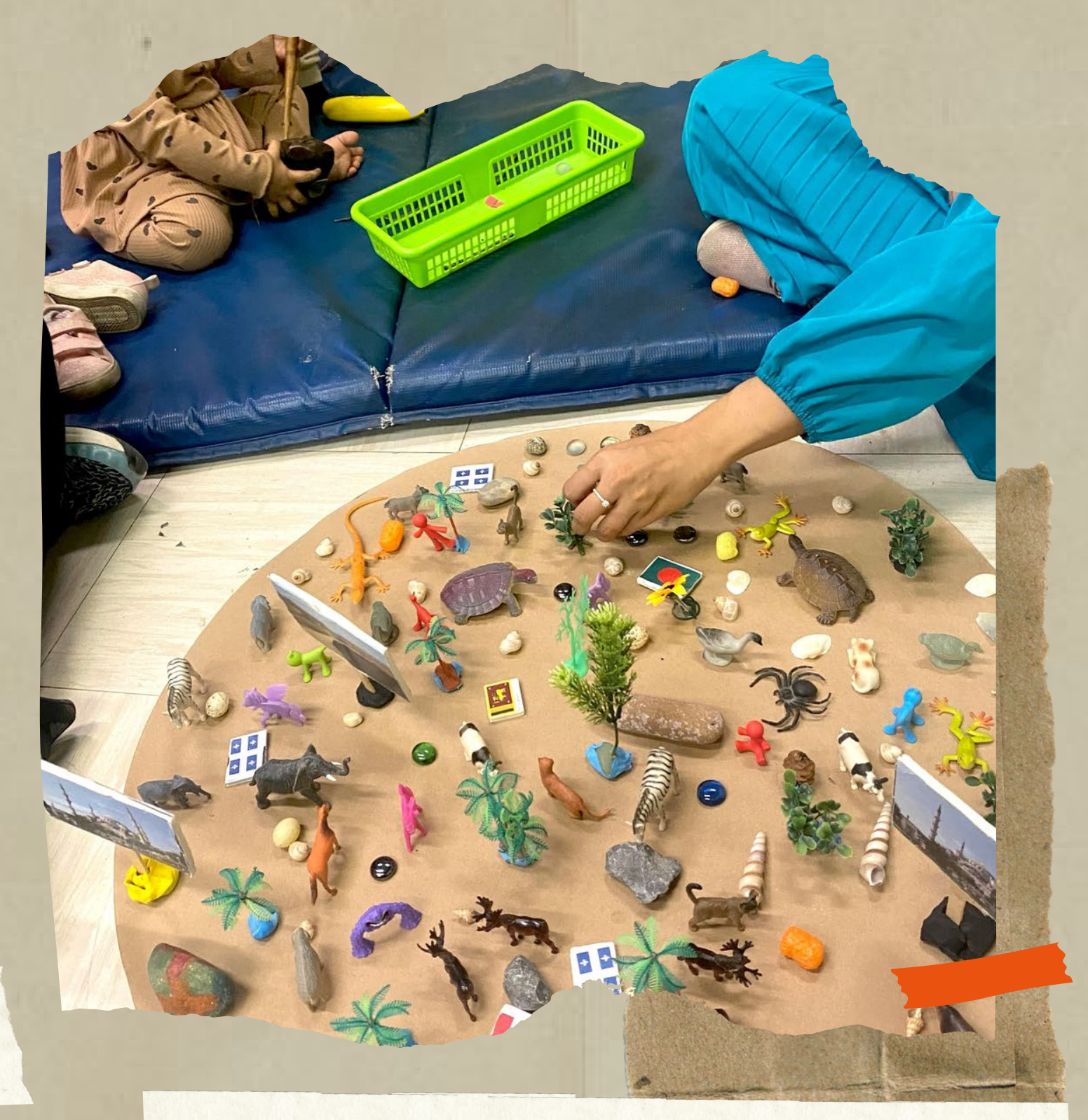
Challenges are learning opportunities that enrich the experience

The flexibility and adaptability of families and caregivers