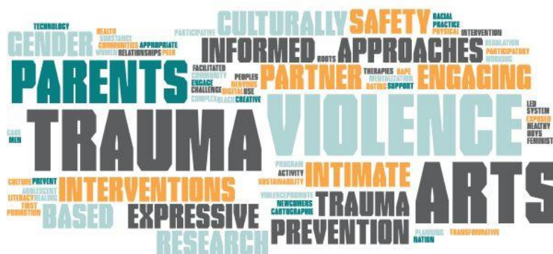
Figure 1 : Nuage de mots indiquant l'expérience et les connaissances que les membres de la CdP sont prêts à partager