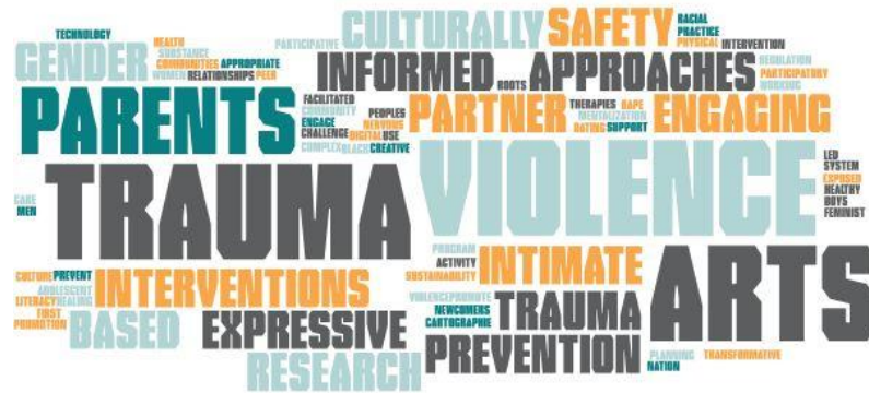
Figure 1: Word Cloud identifying experience and knowledge CoP members are willing to share